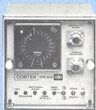
CFE 645 Con orologio giornaliero