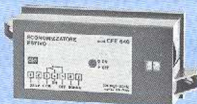
CFE 640 Senza orologio